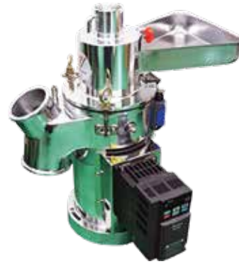
NH-20S 인버터사양 옵션